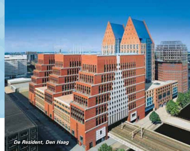
De Resident, Den Haag

Das Master-Studium basiert auf dem Bachelor-Studium. Die Vertiefung der immobilienpezifischen Bereiche der Lebenszyklusphasen einer Immobilie hinsichtlich ingenieur- und wirtschaftswissenschaftlicher, energetischer, architektonischer sowie rechtlicher Aspekte kann wahlweise in der Spezialisierung einzelner Themenkomplexe der Immobilientechnik und Immobilienwirtschaft oder als Ausbildung zum Generalisten erfolgen.